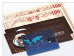
可混合使用多種付款方式