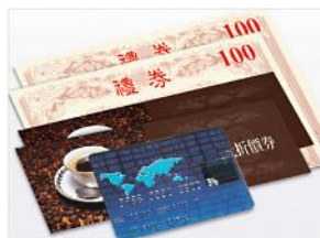
可混合使用多種付款方式